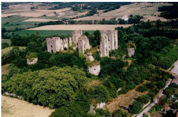
Château de Lagarde

ALAIGNE : Village circulaire. Porte de Pépi et Porte d'Arres