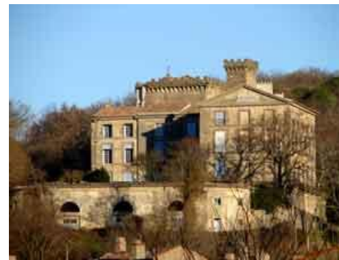
Château de Chalabre