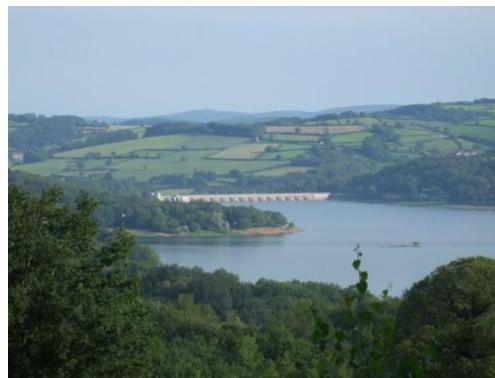
Lac de Montbel