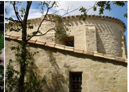
Chapelle de Besplas