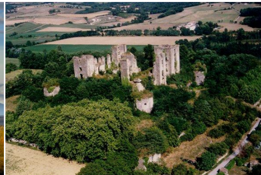
Château de Lagarde près de Corbières