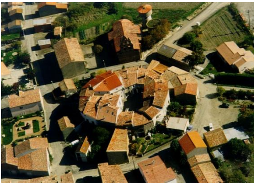
Villeneuve les Montréal

Le château tombe peu à peu à l'abandon et fut en ruines à partir de la Révolution. Dès le début du XX e siècle, il n'en demeurait déjà plus que des vestiges témoignant de son faste et de sa grandeur passés.