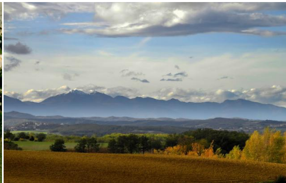
Vue sur les Pyrénées Le Pic St Barthélémy