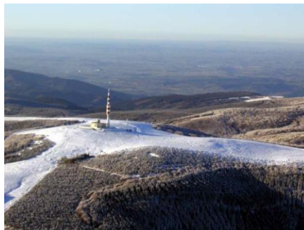
Et Pic de Nore