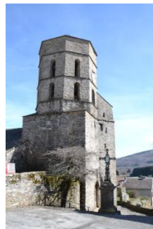
Eglise St Jean Baptiste de Pradelles