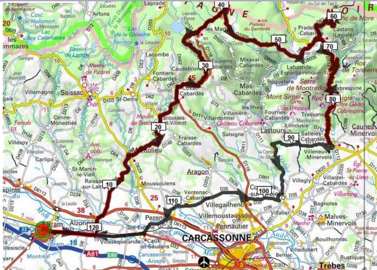
BRAM [Pic de Nore par route des crêtes]