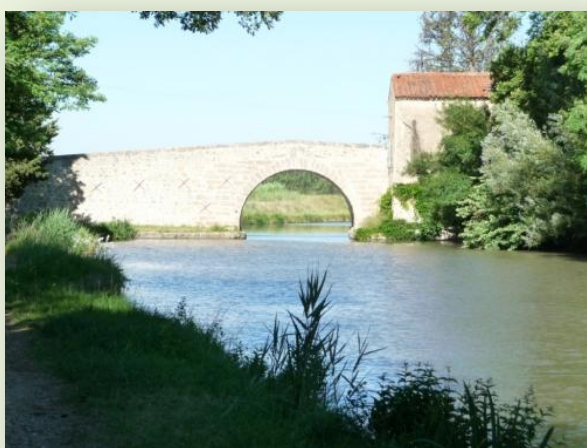
Un pont du Canal B