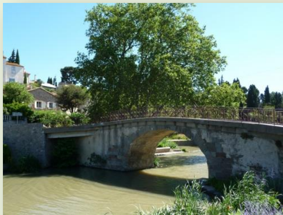
Un pont du Canal A