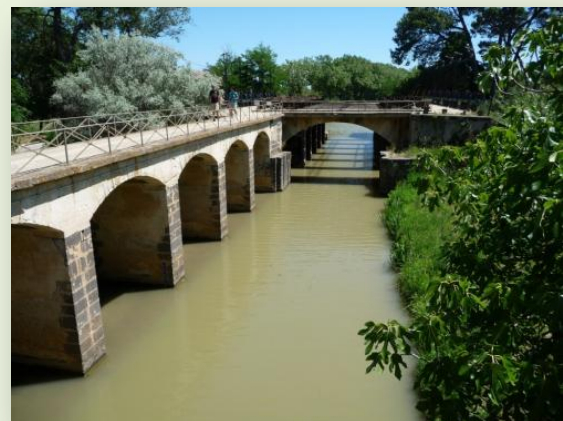
Ouvrage du Libron