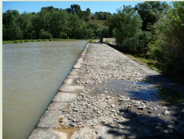
Le Canal du Midi possède aussi son Pont Canal