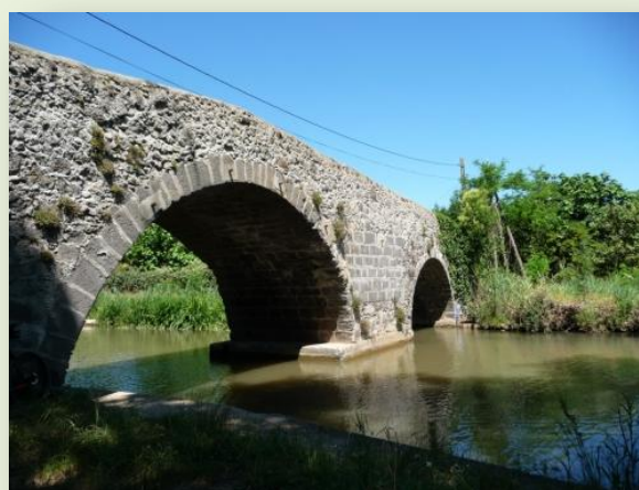
Pont à double arche

De petit-port en petit-Port, le Canal expose ses œuvres d'arts