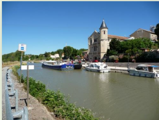
La Cave coopérative

En juin la fréquentation des berges est impressionnante, vous croisez, vous doublez, vous êtes doublé, par des cyclos, Allemands, Anglais, Espagnols et nombre de couples avec des machines souvent pas adaptées à leurs morphologies, l'ambiance est courtoise entre cyclistes et bateliers de plaisance, c'est la convivialité de tous les utilisateurs du canal.