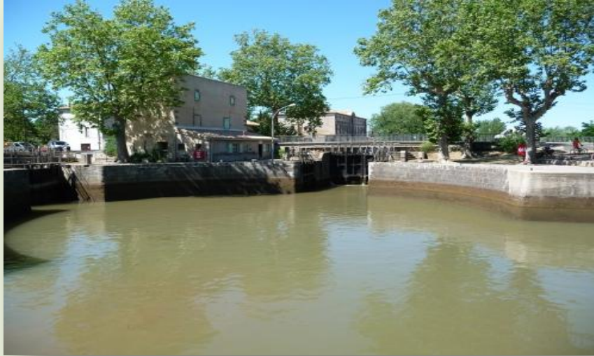
Ecluse ronde Agde