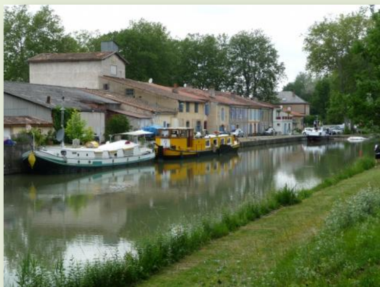
le Petit port

De petit-port en petit-Port, le Canal expose ses œuvres d'arts