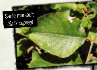
Saule marsault ( Salix caprea )