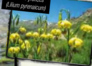
Lis des Pyrénées ( Lilium pyrenaicum )

Cette extraordinaire vallée, qui recrée à la perfection ses origines glaciaires, accueille l'un des plus beaux lacs d'Andorre, d'une superficie de plus de 4 hectares, ainsi que deux autres lacs moins étendus, qui rendent le parcours encore plus attrayant.