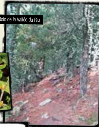
Bois de la Vallée du Riu