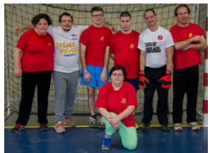
Equipe de Floirac