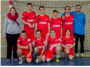
Equipe de Bergerac