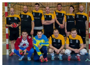
Equipe de Marmande