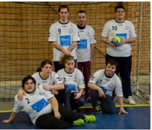
Equipe de Médoc 2