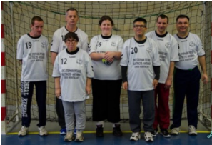
Equipe de Médoc 1