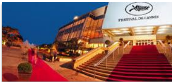
LE PALAIS DES FESTIVALS