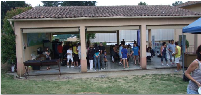
LES OISEAUX MOUGINS