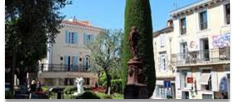
LA PLACE DE MOUGINS VILLAGE