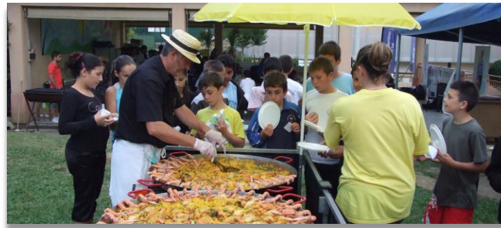
LES OISEAUX MOUGINS