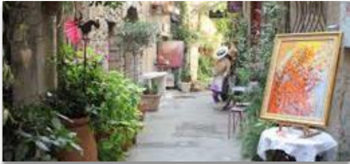
RUE PITTORESQUE DE MOUGINS VILLAGE