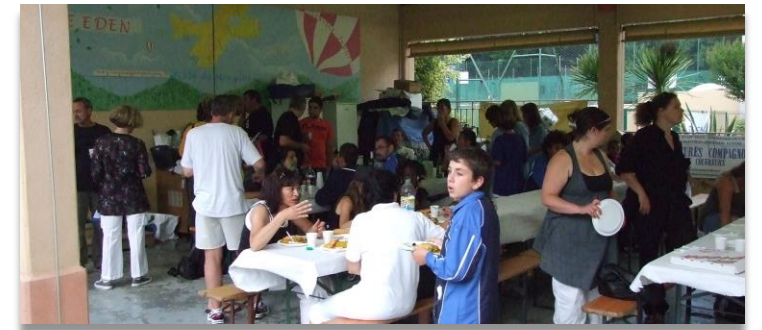
LES OISEAUX MOUGINS