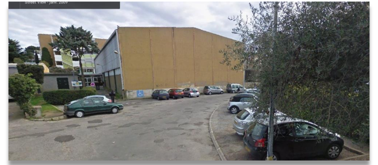
LES CAMPELLIERES MOUGINS