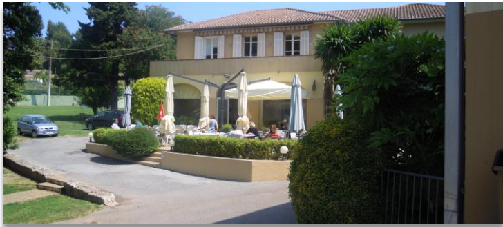
COMPLEXE SPORTIF ROGER DUHALDE MOUGINS