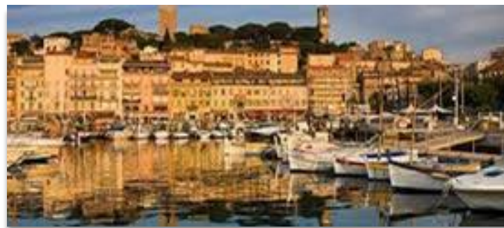
LE VIEUX PORT ET LE SUQUET