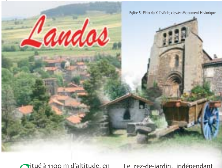
Eglise St-Félix du XI e siècle, classée Monument Historique