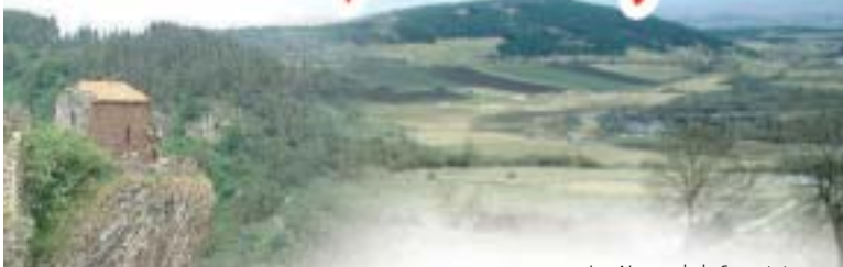
Les Narces de la Sauvetat

Entre les Gorges de l'Allier et de la Loire, découvrez de magnifiques paysages et appréciez la qualité de l'air de la moyenne montagne. Ses sites remarquables des marais de La Sauvetat et de Ribains, au cœur des zones humides du Devès, recèlent des trésors de faune et de flore que vous pourrez découvrir en suivant les chemins de randonnées avec la possibilité d'intervenants spécialisés.