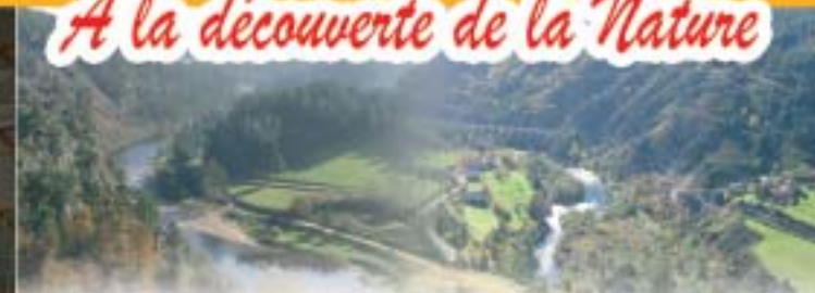
La Vallée de la Loire