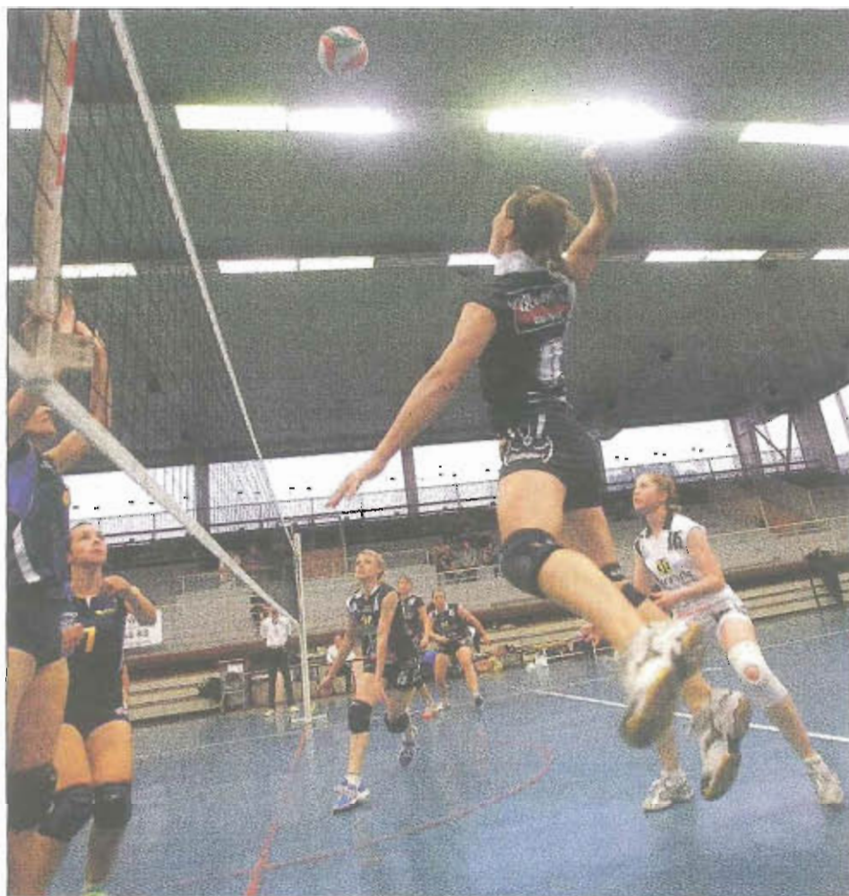
Les volleyeuses dracénoises peuvent désormais et enfin savourer leur accession en Nationale 3 après leur succès à Hyères.

Prochaine et ultime sortie samedi à 19 heures face au Pradet-La Garde. Un match sans enjeu sur le papier mais que les Dracénoises auront à cœur de gagner aux dires de leur coach : « On a vraiment à cœur de terminer la saison sur une victoire devant nos supporters. On veut rester intouchable à domicile. Après la rencontre, il sera alors l'heure de décompresser et de fêter l'accession en Nationale 3 ».