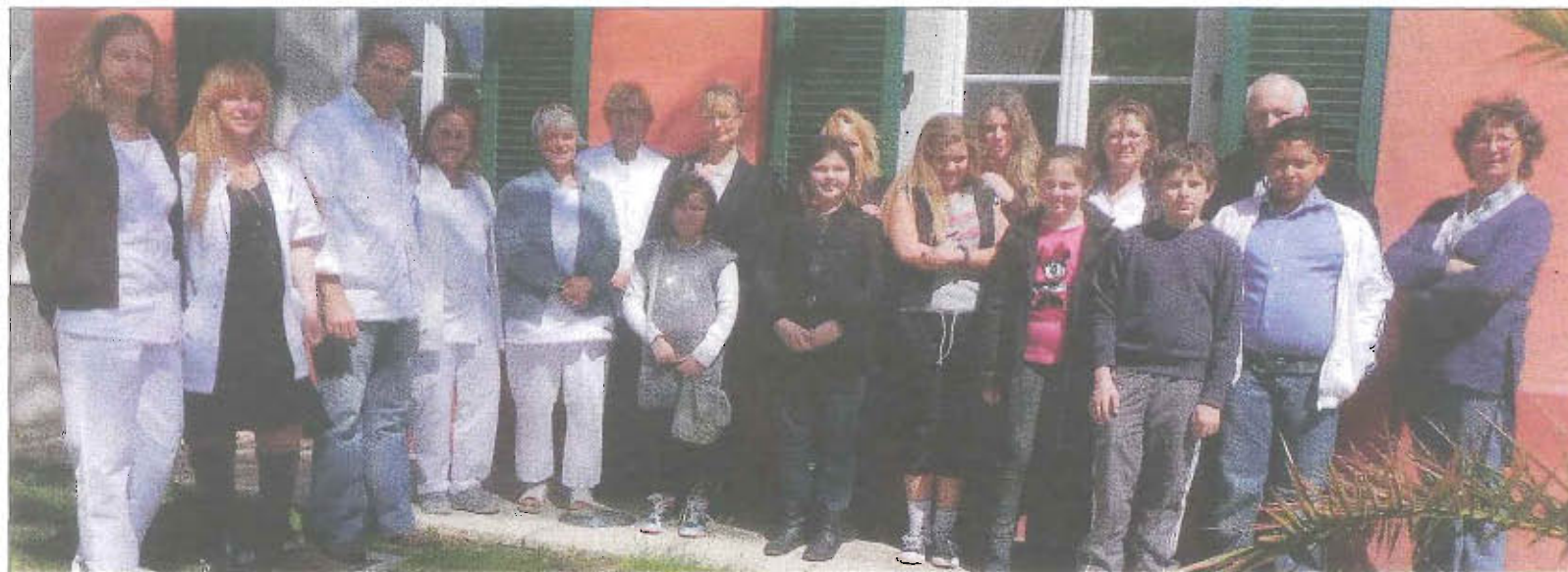
Les participants au nouveau programme « Éducation thérapeutique de l'enfant et l'adolescent en surpoids », entourés des médecins référents du centre hospitalier.

Depuis deux mois, le centre hospitalier étrenne un programme d'éducation thérapeutique pour les enfants de 8 à 12 ans. Parole de maman : les effets directs se font rapidement sentir