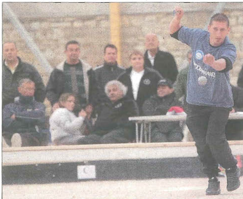
Les phases finales se sont déroulées en indoor, hier à Draguignan.