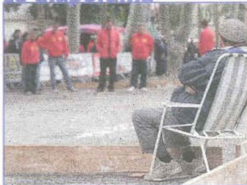
Le National au jeu provençal