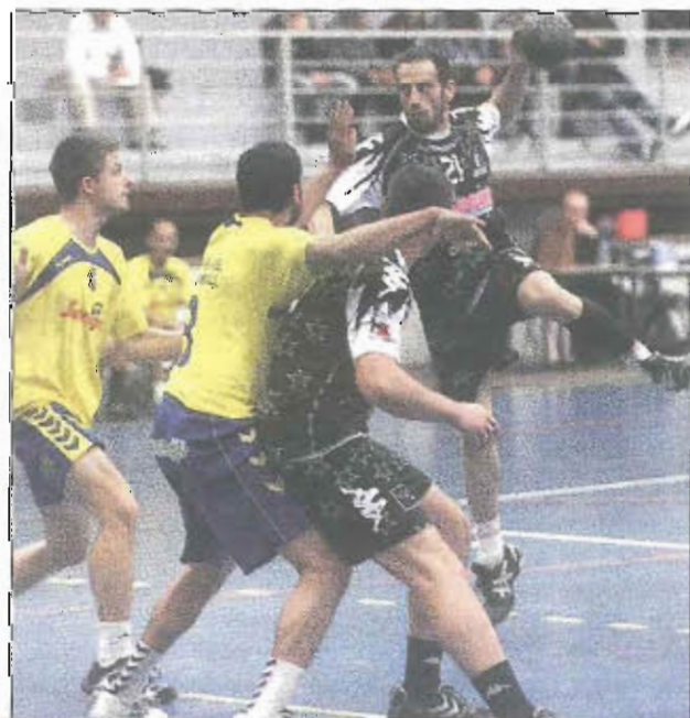
En s'imposant samedi à La Valette, les Dracénois se sont ouverts les portes de la Nationale 3.

Il ne reste plus qu'aux protégés de Loïc Gérard de terminer le travail samedi prochain à l'occasion de la réception du Cavigal de Nice dans le cadre de la mise à jour du calendrier.