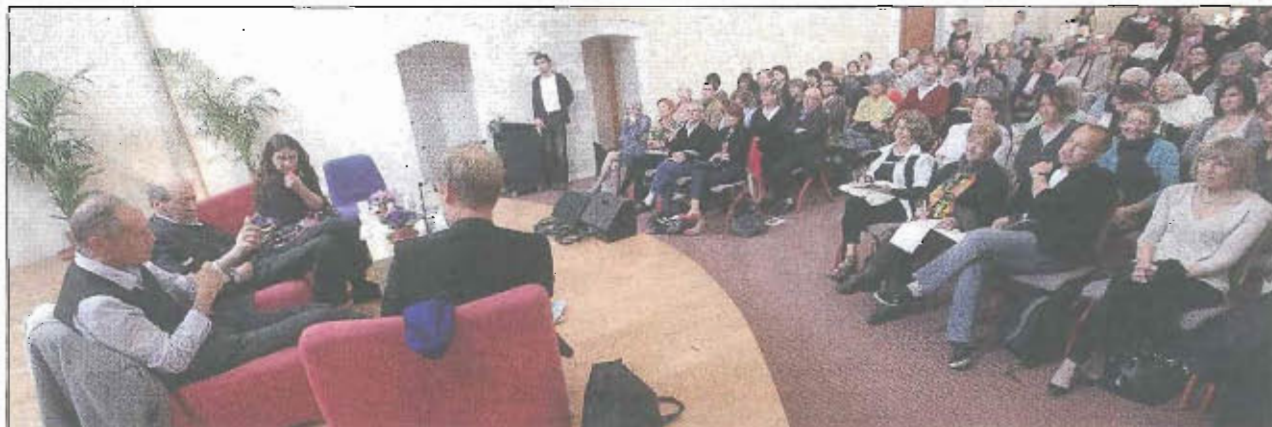
Hier, Erri de Luca et Giorgio Pressburger ont échangé avec les lecteurs dracénois, à la chapelle de l'Observance.

Silence de cathédrale à la chapelle de l'Observance. Hier, en fin de matinée, les lecteurs varois sont venus en nombre pour assister aux dernières heures des « Escapades littéraires ». Pendant près d'une heure, ils ont écouté religieusement Erri de Luca et Giorgio Pressburger, les deux écrivains transalpins à l'honneur de cette deuxième édition consacrée à la littérature italienne. Thème de cette table ronde, animée