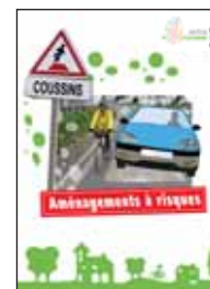
Analyse d'un aménagement à haut risque.

Tous ces documents n'ont pas pour objectif de se substituer aux diverses directives et circulaires existantes tel que , le RAC (Recommandations pour les aménagements cyclables), document technique du Certu qui aborde déjà ces préoccupations ; mais de les compléter ou de les réactualiser en fonction de l'expérience des pratiques au sein de la FFCT.