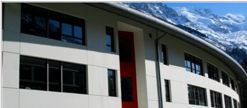
Collège Roger Frison Roche