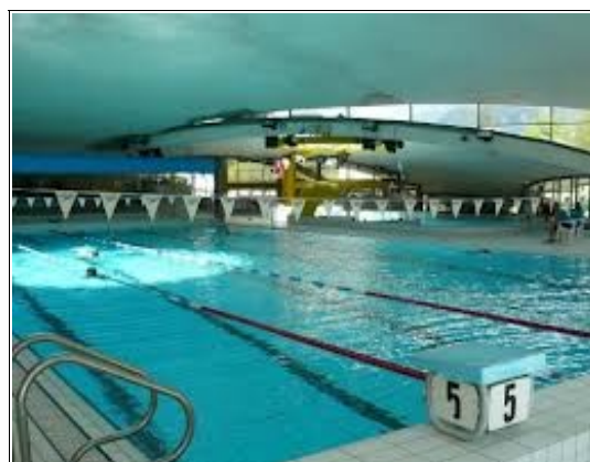
Piscines du centre sportif Richard Bozon

Collège Roger Frison Roche promenade du Fori BP 9 74400 CHAMONIX téléphone : 04 50 53 15 16 fax : 04 50 53 62 88