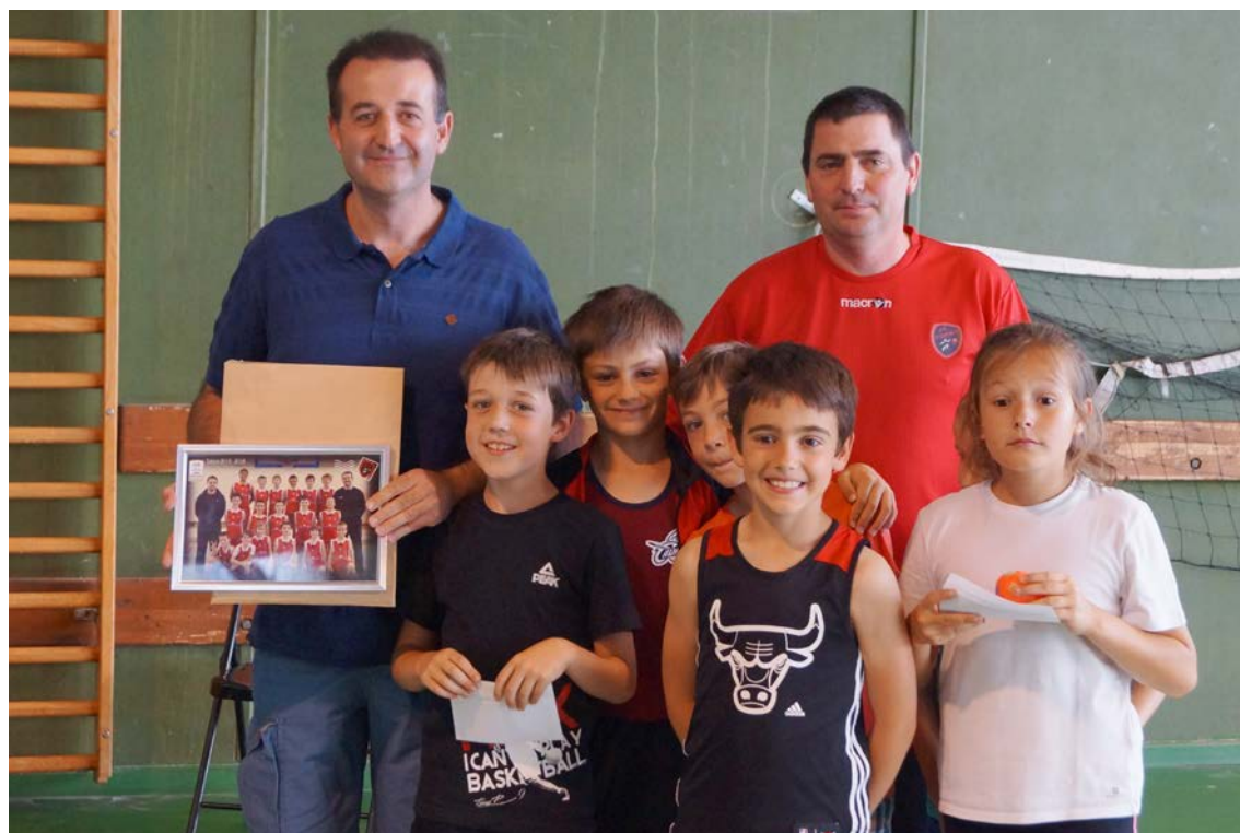
L'équipe de la saison