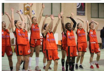
Les SF1 en N3 !