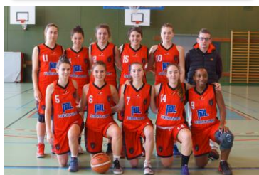
Direction la finale de Coupe pour les SF2