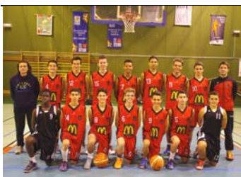
Equipe du moment