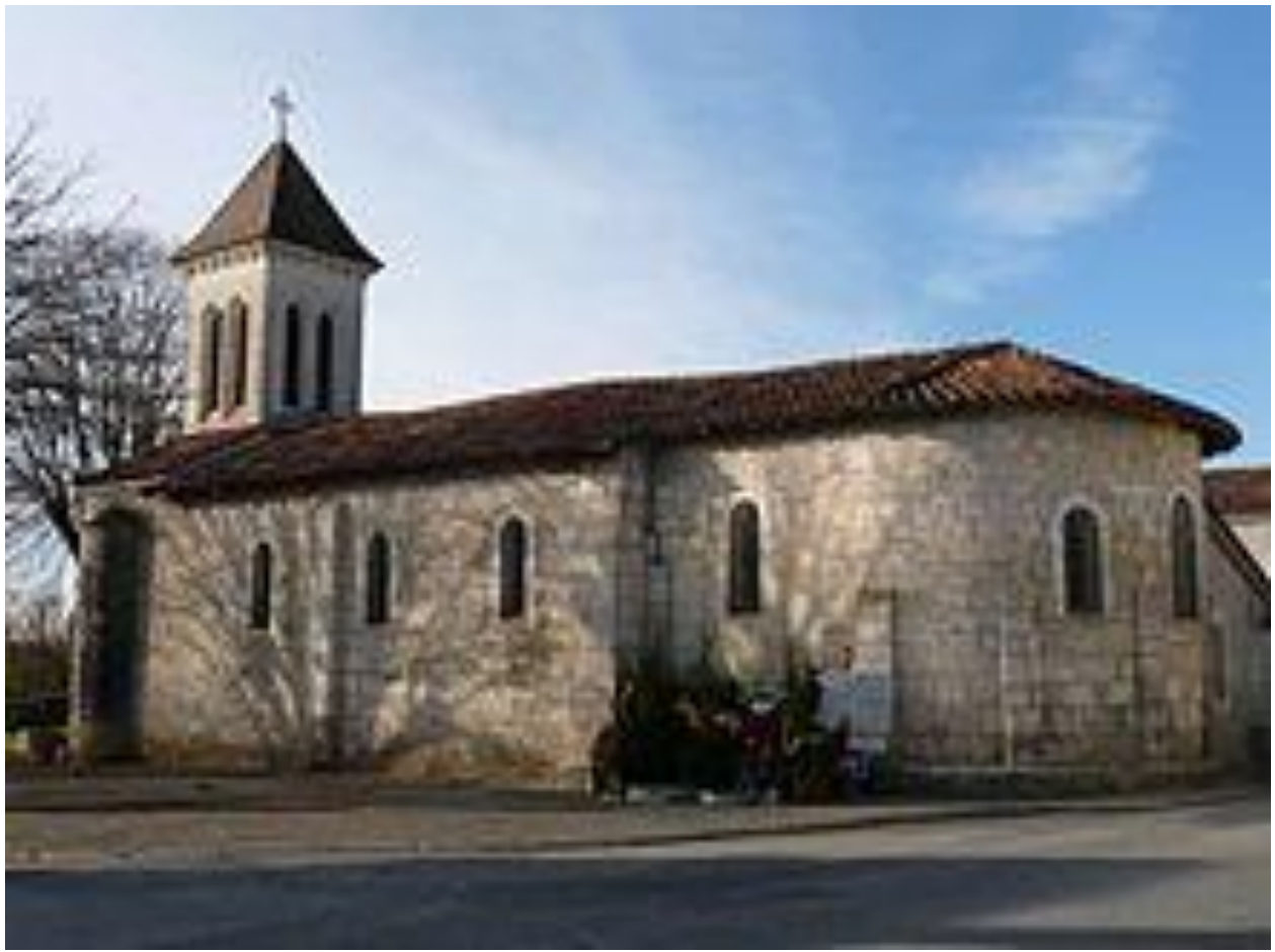
l'église St Saturnin de Petit Bersac et son Musée