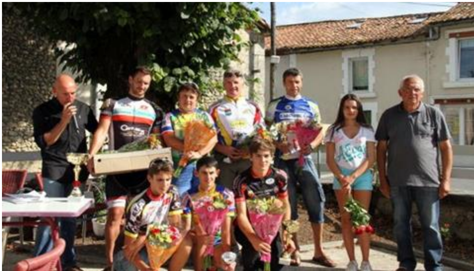
Les lauréats de la première course organisée dans la Commune