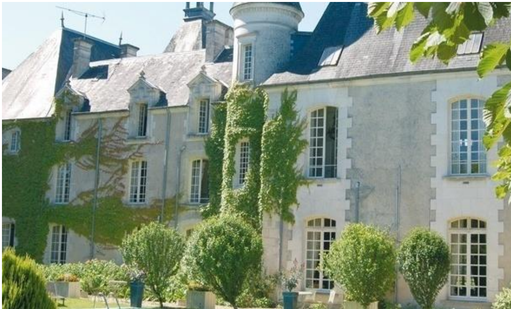
Château Le Mas de Montet 24600 Petit-Bersac