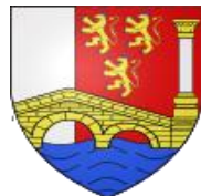
Armoiries de Petit Bersac

Petit-Bersac est un petit village limitrophe avec la Charente (St Séverin à 3 km) , ses habitant(e)s sont appelé(e)s les Bersacois et les Bersacoises. Dans les années 1950 la gare SNCF, aujourd'hui abandonnée , était active et reliait la ligne Ribérac - St Aigulin . Petit Bersac s'étend sur 10,8 km 2 et compte 176 habitants, elle est située à 53 mètres d'altitude, la rivière Dronne traverse la commune . Le village a connu sa première course cycliste en 2015 même si le Tour du Canton Ribérac – Mareuil - Verteillac y a fait quelques passages .