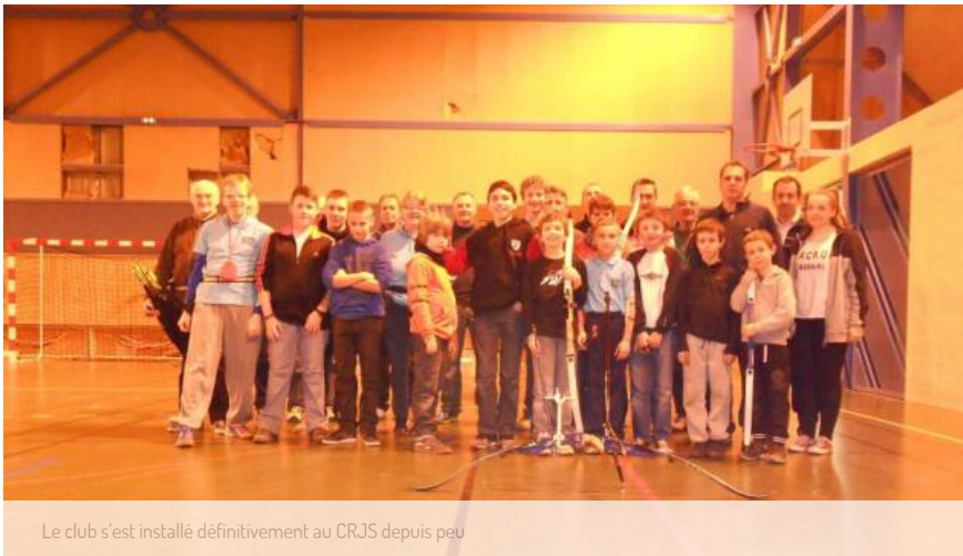
Le club s'est installé définitivement au CRJS depuis peu